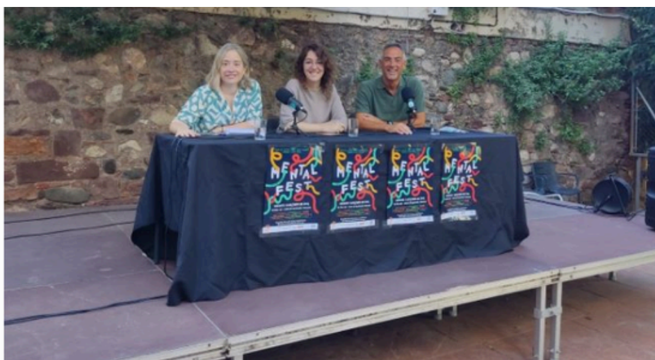
Roda de premsa de presentació de la 2a edició del Mental Fest

Ahir es va presentar la segona edició d'aquest festival que tindrà lloc el proper 5 d'octubre al Parc de Vallparadís i que cerca visibilitzar la importància del benestar emocional i fomentar un diàleg obert sobre la salut mental