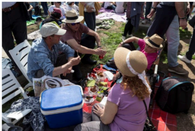
La nevereta per a les begudes / LLUÍS CLOTET

De fet, l'epicentre del Pícnic és l' escenari Vela . Des d'allà dalt va anar presentant els grups, un darrere l'altre, el mític Valentí Grau. Micròfon en mà i acolorida camisa al tors, el codirector artístic del festival va adreçar unes paraules amb la seva "vibratio" i emoció habitual.